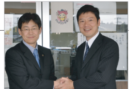
＜茨城県高萩市 草間市長と＞